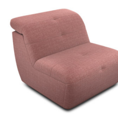
E100 (82 cm x 74 cm x 99 cm)