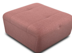
P000 (82 cm x 43 cm x 97 cm)