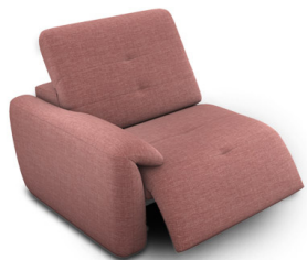
B100EL (98 cm x 74 cm x 99 cm)