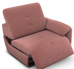
B100ER (98 cm x 74 cm x 99 cm)