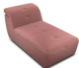
CH00 (82 cm x 74 cm x 165 cm)