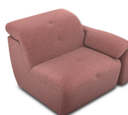
B100ER (98 cm x 74 cm x 99 cm)