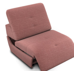
E100EL (82 cm x 74 cm x 99 cm)