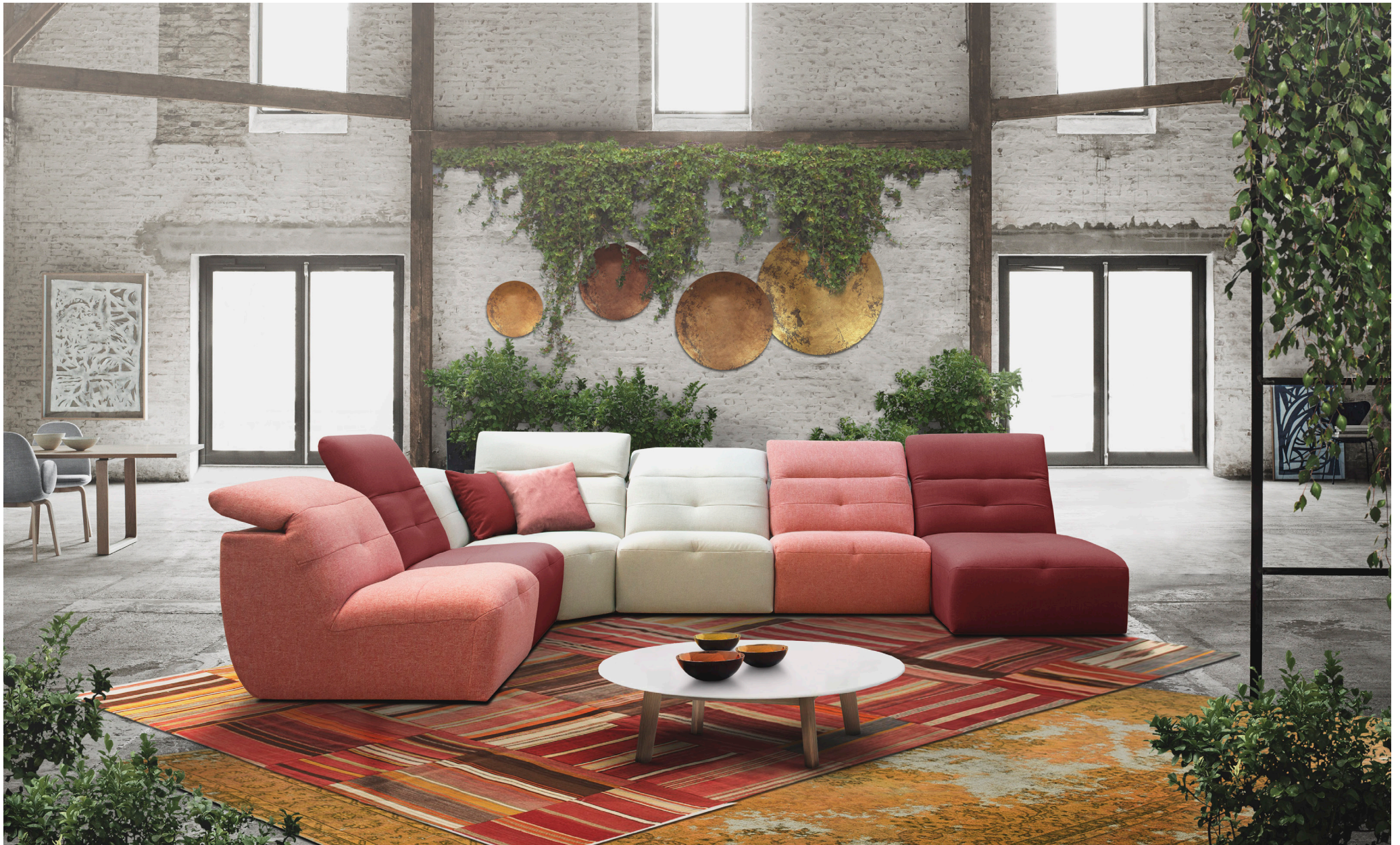
Elements (Fabrics): E100 (Castle 160) + E100 (Braga 63) + EK03 (Castle 60) + E100 (Castle 60) + E100 (Castle 160) + CH00 (Braga 63)