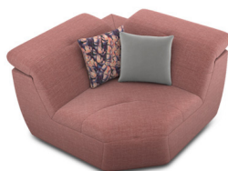
EK03 (123 cm x 74 cm x 123cm)