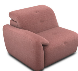
B100EL (98 cm x 74 cm x 99 cm)